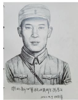
“神笔警探”绘出的张厚义烈士像