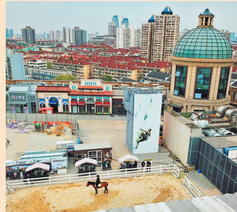
普陀区环球港5楼屋顶的空中马场吸引了越来越多青少年马术爱好者在此练习

屋顶上还能坐摩天轮。沪上新地标上海大悦城摩天轮，是国内首个悬臂式，直径56米，距离地面98米。每逢重要节日，摩天轮会上演各类灯光秀。随着摩天轮缓缓上升，被都市森林包围的人们能无拘无束地投入星空怀抱。俯瞰繁华大都市时，又不免发现越来越多的屋顶闲置空间正变为风景看台、未来舞台、机会平台，这也印证了古人言“欲穷千里目，更上一层楼”。