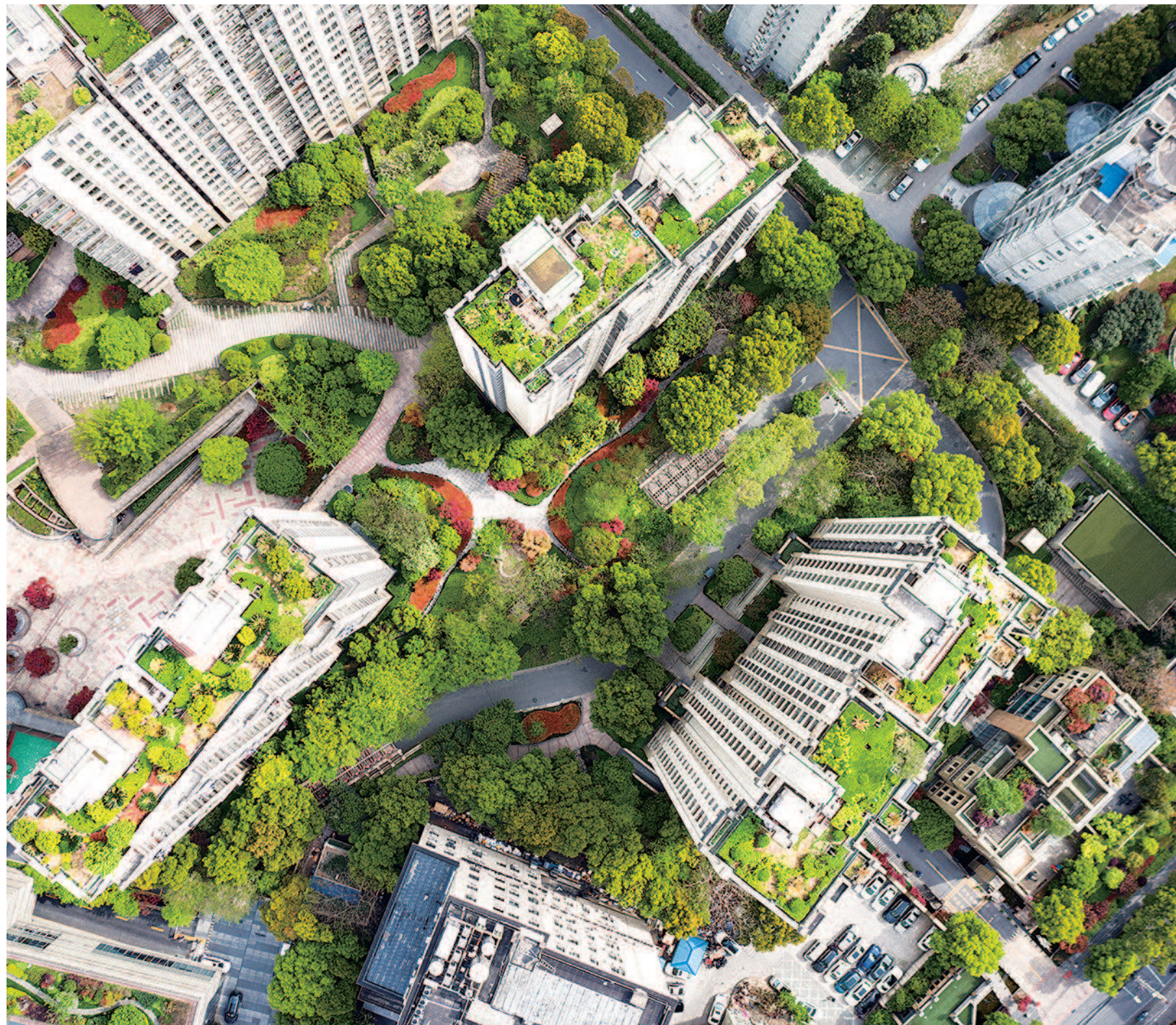
位于宜昌路上的苏州河畔居民小区，楼顶被打造成空中花园