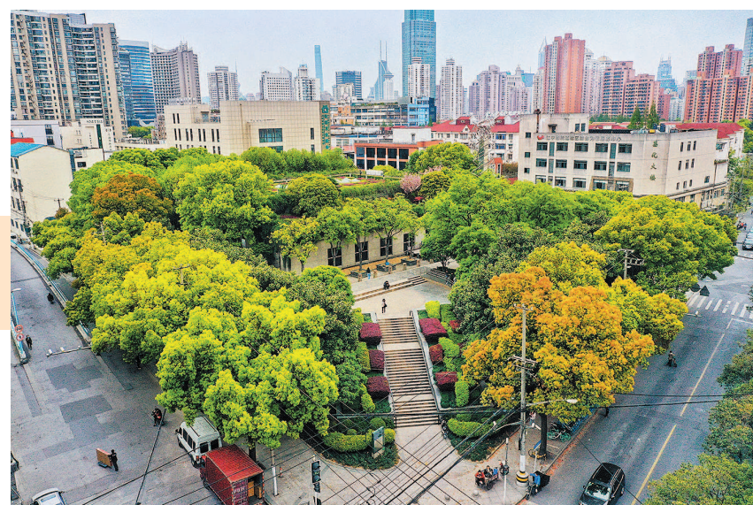
静安固体废弃物流转中心屋顶有落差不同的四个平台，设置有广场、廊架、水池、雕塑、小径等，形成一个开放式的空中花园，成为周边居民休闲的好去处