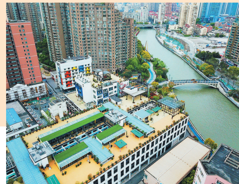
普陀区创享塔园区的屋顶平台视野开阔，可俯瞰苏州河宝成湾全景。平台还建有部分玻璃房，可供办公、会议、活动使用，均配置落地门窗，阳光通透