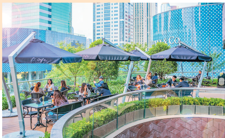
新天地广场裙楼楼顶的露天咖啡座上，市民可以在一边品咖啡一边欣赏淮海路的繁华景象