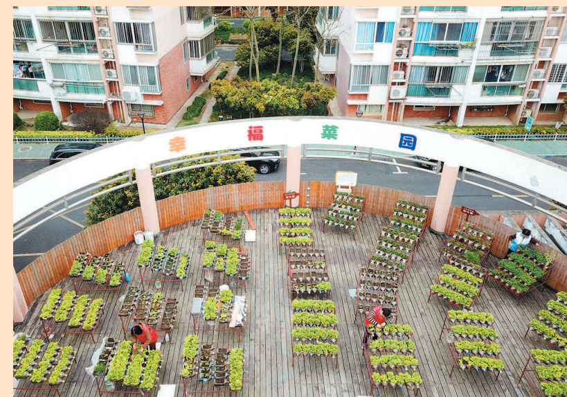
金山石化街道紫卫居委会的楼顶如今成为一个由1500多个废弃的瓶子组成的屋顶“瓶子菜园”。居民志愿者们利用废弃的油瓶、矿泉水瓶等种植各种蔬菜。大家一起劳动，又增加环保意识