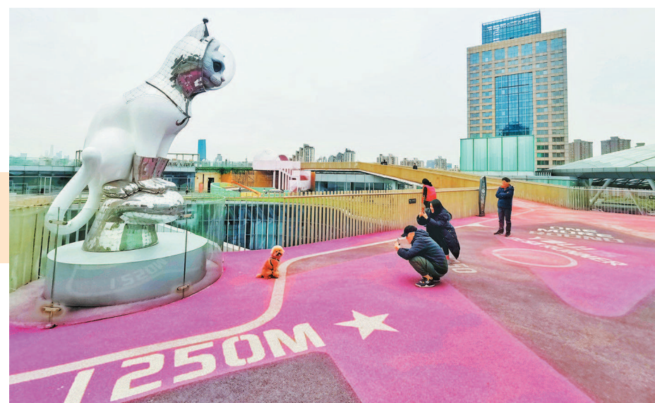
长风大悦城登高公园里不少市民前来打卡体验楼顶粉色步道