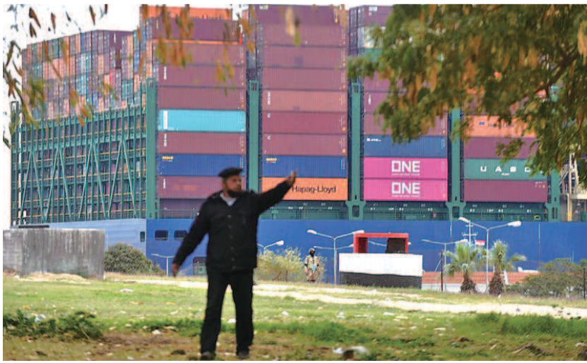
■ 货轮在苏伊士运河上航行

3月23日, 一艘悬挂巴拿马国旗的重型货轮在苏伊士运河新航道搁浅, 导致运河大堵塞。经过连续几天救援后, 搁浅货轮3月29日成功起浮脱浅。