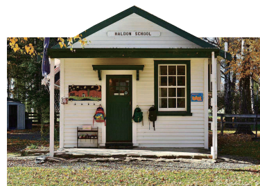
他们则按照结构化的课程计划进行学习。

格雷厄姆说,他们喜欢成为新西兰最小的学校,孩子们每个星期五都去Tekapo学校上课,这是他们与同龄人互动的好方法。 王浩