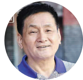
叶辛：中国作家协会副主席

上春树的文学偶像，村上春树称赞道：“欧文是大胆无视了所谓（当代文学）价值观的人。有时，他甚至固执地扫荡了那些关于文学的固有观念。”