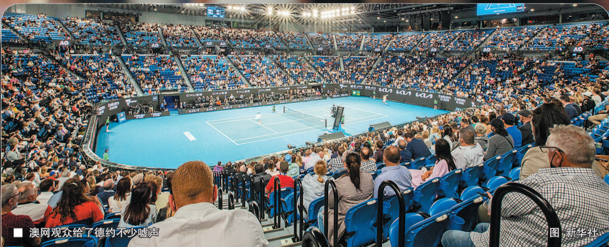
■ 澳网观众给了德约不少嘘声