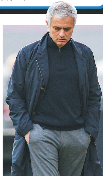
■ 球队成绩不佳让穆帅“体面”不起来 图 5