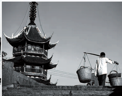
尔冬强镜头里的江南