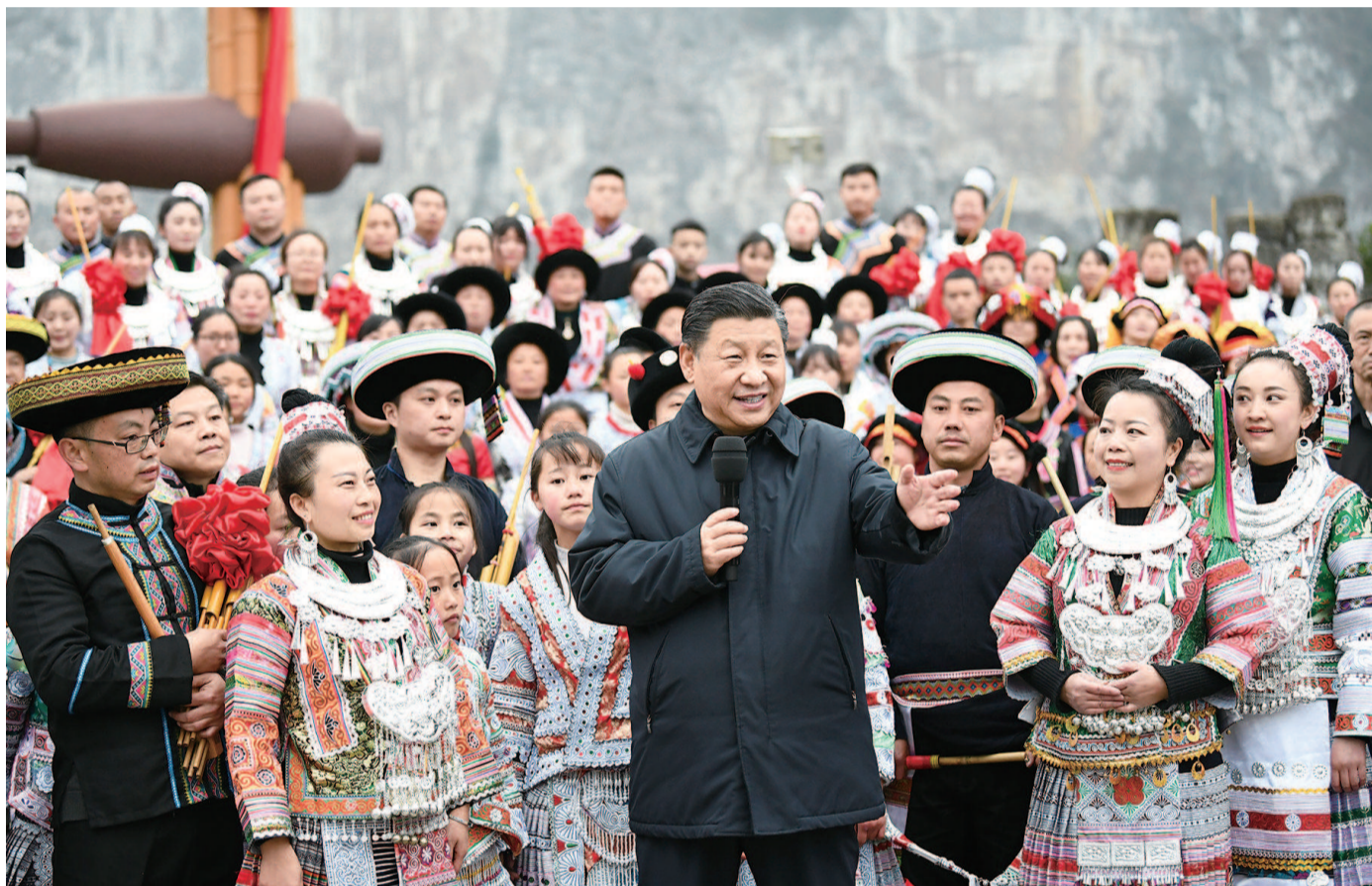
■ 习近平春节前夕赴贵州看望慰问各族干部群众

■ 共同富裕本身就是社会主义现代化的一个重要目标,要坚持以人民为中心的发展思想,尽力而为、量力而行,主动解决地区差距、城乡差距、收入差距等问题,让群众看到变化、得到实惠