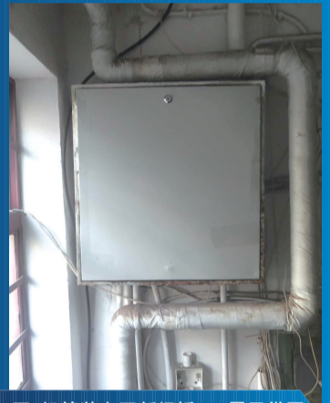
机箱装上了新门板