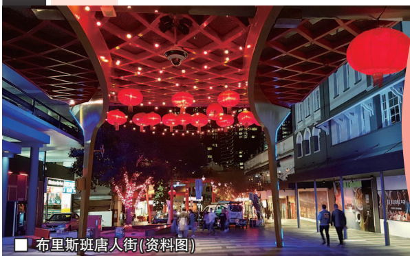
布里斯班唐人街(资料图)

农历新年庆祝活动将于2月13日在唐人街举行，洒红节需持票入场。新增的美食节将于2月20日至21日举行。市长阿德里安·施林纳说：“我们已经按照昆士兰健康安全指南开展这些活动，加强了安全措施，所有场馆都作了清洁，并使用二维码系统协助追踪接触者。”萧雷