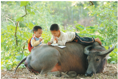
万物萌发之时，两位小朋友在牛背上写作业