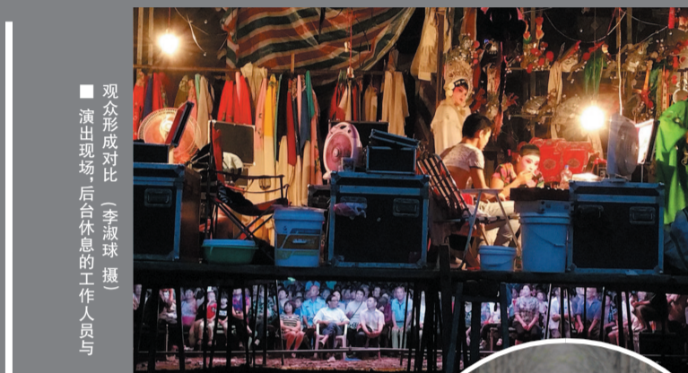
观众形成对比，演出现场，后台休息的工作人员与