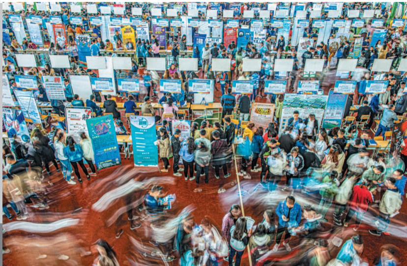
在招聘会现场，年轻人形成靓丽的风景