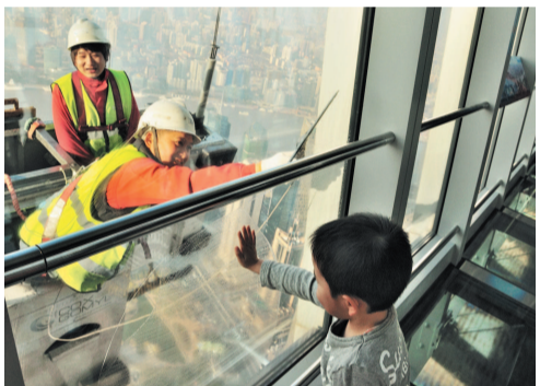
高楼外墙清洁人员与室内的小朋友互动