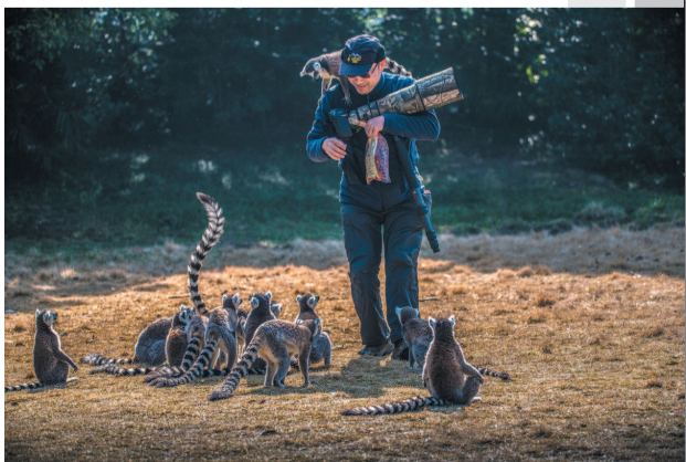
摄影师在野外拍摄时受到环尾狐猴的“热情欢迎”