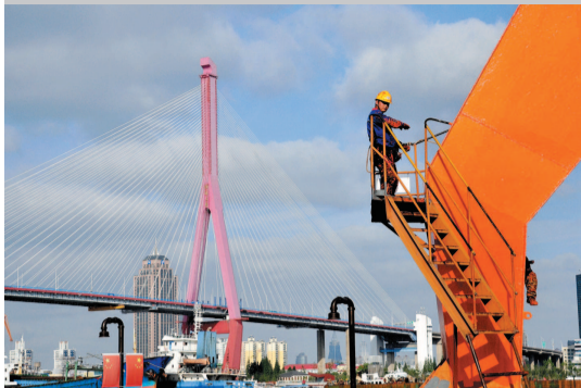
一名漆工正在做最后的收尾工作

就在这新年年初，让我们用心去感受世界：向阳，能把阴影留在后方；逆光，能将内心照得敞亮。带着美好的心境出发，愿世界更美好。