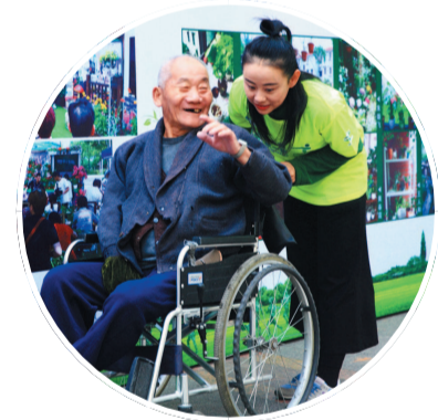
志愿者推着坐轮椅的长者在公园里散步