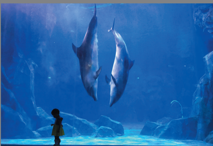
两只海豚正在表演，一位小朋友走过