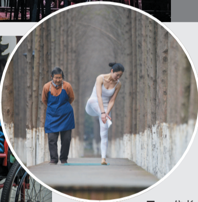
一位长者从林间晨练的女子身边经过