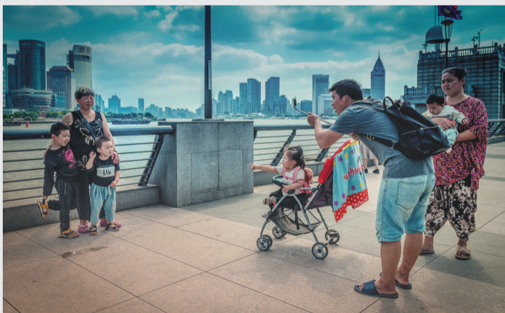
游客一家人在上海外滩拍照留念