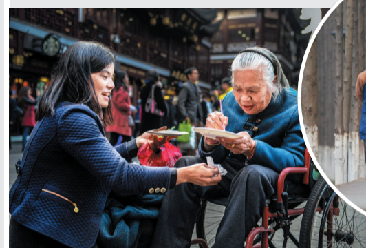
女儿带妈妈体验上海豫园的特色美食：小笼包