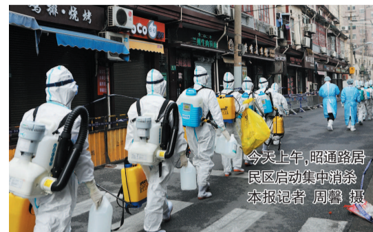
今天上午,昭通路居民区启动集中消杀