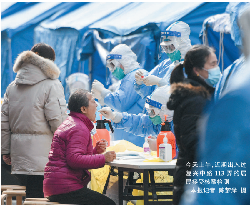
今天上午,近期出入过复兴中路113弄的居民接受核酸检测