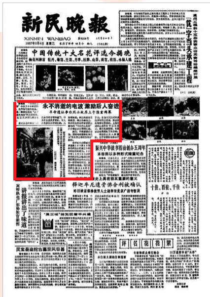
1987年5月6日新民晚报头版