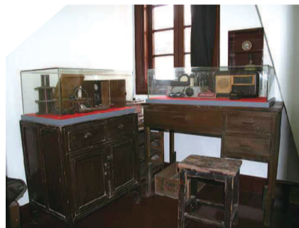
李白烈士故居内景一角

后居住、被捕的地方，就是今天的黄渡路107弄15号。回去后，他便找来一块木牌，请人写上“李白烈士故居”几个字，挂在了门口。后来，木牌换成了铜牌，再后来，又得到了陈云同志的题字，李白烈士故居纪念馆一步步建立了起来。