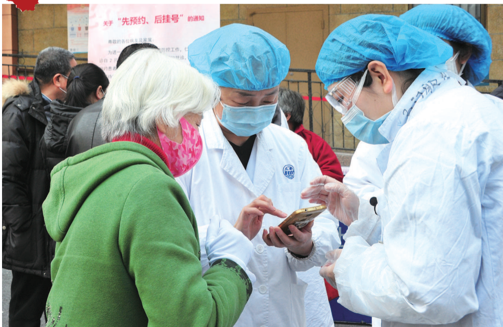
院门外现场指导预约方法,老年患者不擅长使用手机预约就医,仁济医院医护人员在