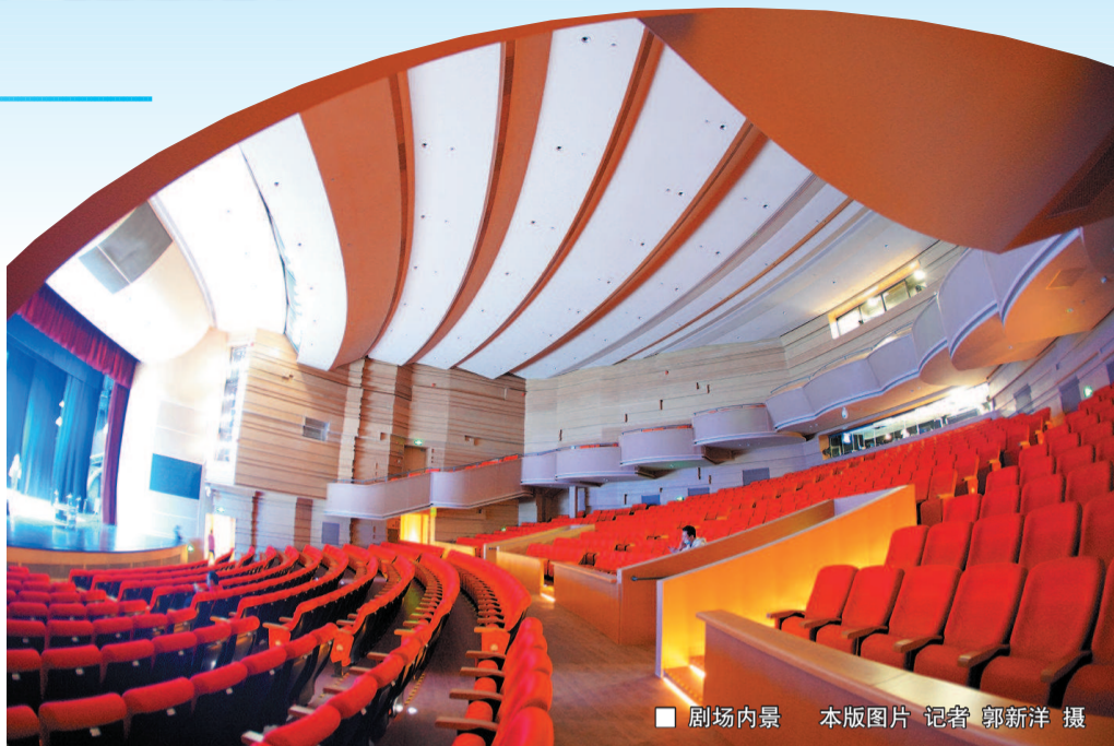
■ 剧场内景

就连内部工作人员都没想到，剧场居然修缮了这么长时间。剧场总经理潘熠文解释，当初上