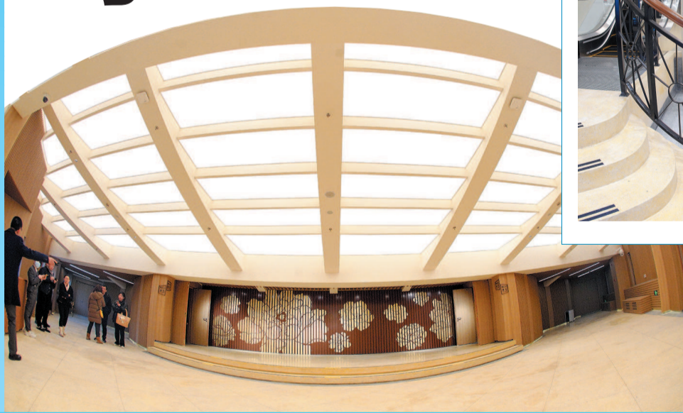
◀ 修缮后的二楼大堂