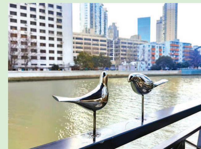
河畔栏杆上的雕塑小景,为苏州河增添了一份灵动