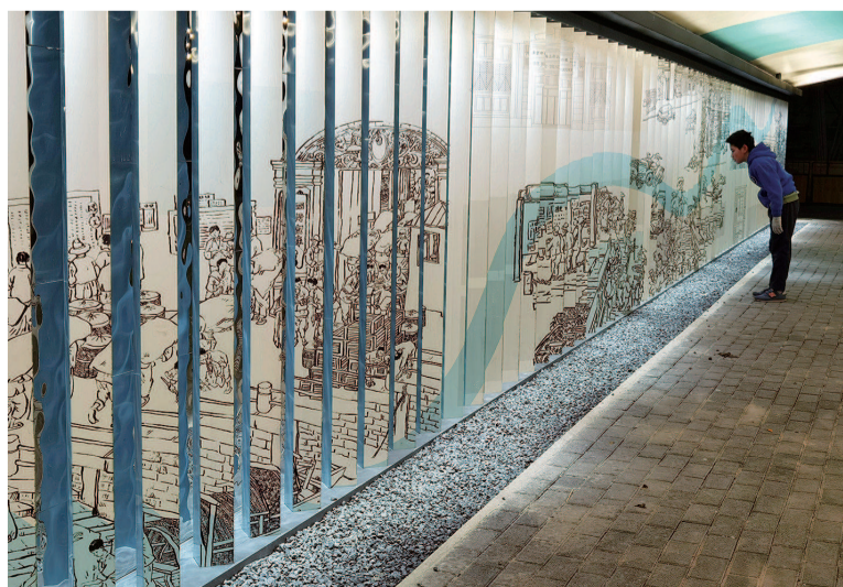
河南路桥下两侧的“穿梭·畅想”以连环画和摄影作品的方式展现城市变迁,步移景异,形成不一样的视觉体验