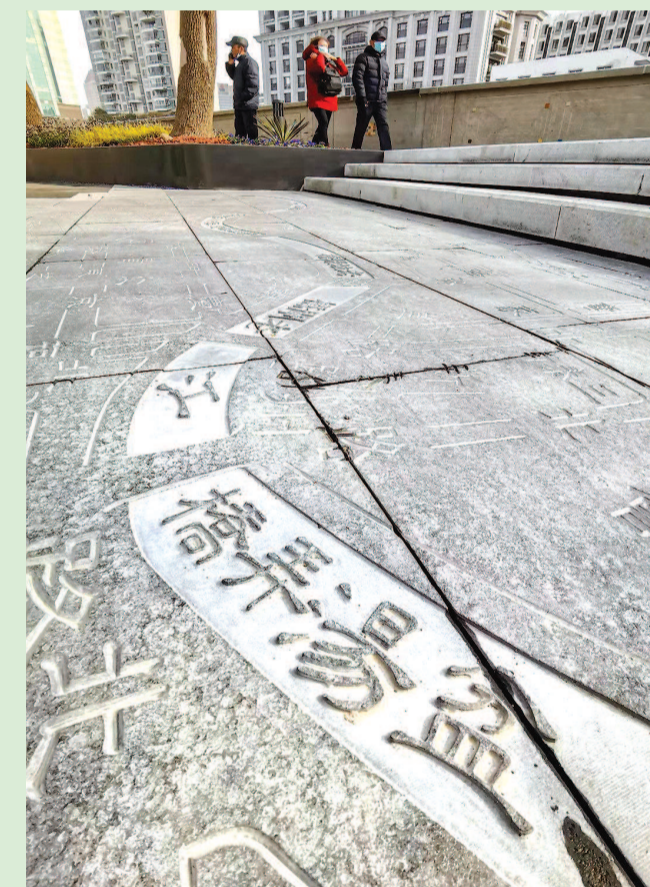
《马路印记》将消失的路名刻在地面上,记录着中城道路的变迁