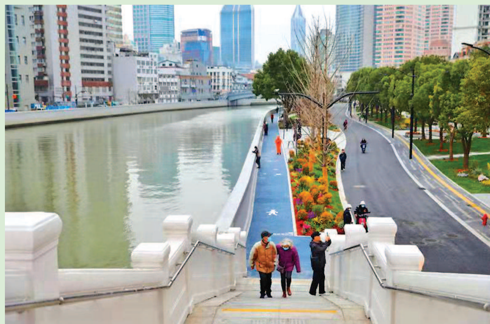
北苏州路河滨的摩登花园扮靓了苏州河沿岸,缤纷的花境构成了商业共享花园街区