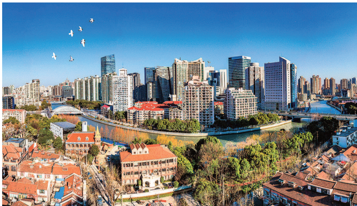
苏州河静安段蝴蝶湾沿岸美景