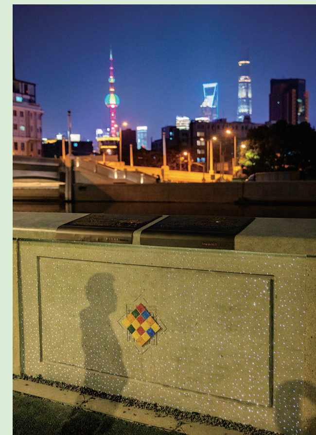
河畔栏杆上选用上海特有的ART DECO建筑装饰符号,并镶嵌复古马赛克。晚间透光混凝土与灯带形成星光墙体,呈现浪漫风情