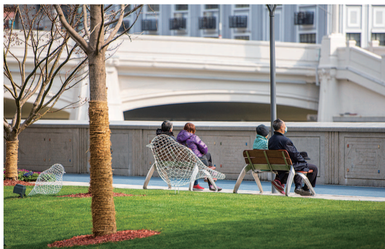
河滨步廊与共享街道之间的街景绿化经过精心设计后,打造成有意境、易亲近的客厅花园