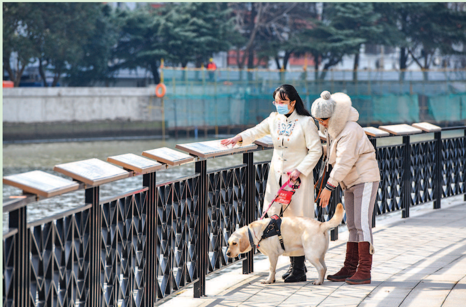
一位视障人士正在用手感知苏州河畔镌刻的盲文诗句