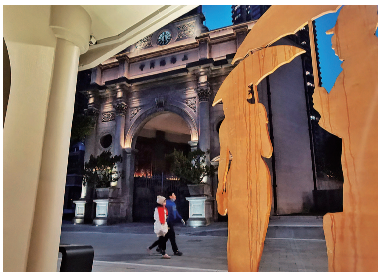
上海总商会旧址旁的《时代定格》装置运用锈色钢板剪影,再现老上海风情