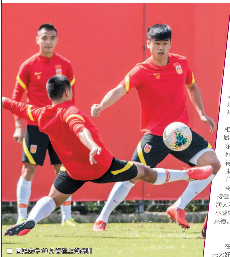
国足去年 10 月曾在上海集训

隔离期间的区别对待,也让组委会成为舆论的焦点。世界排名第 72 位的法国选手查迪在接受采访时表示,在最应讲究公平竞争的职