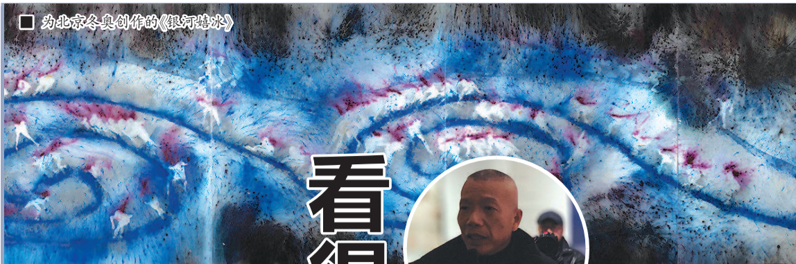
为北京冬奥创作的《银河嬉冰》