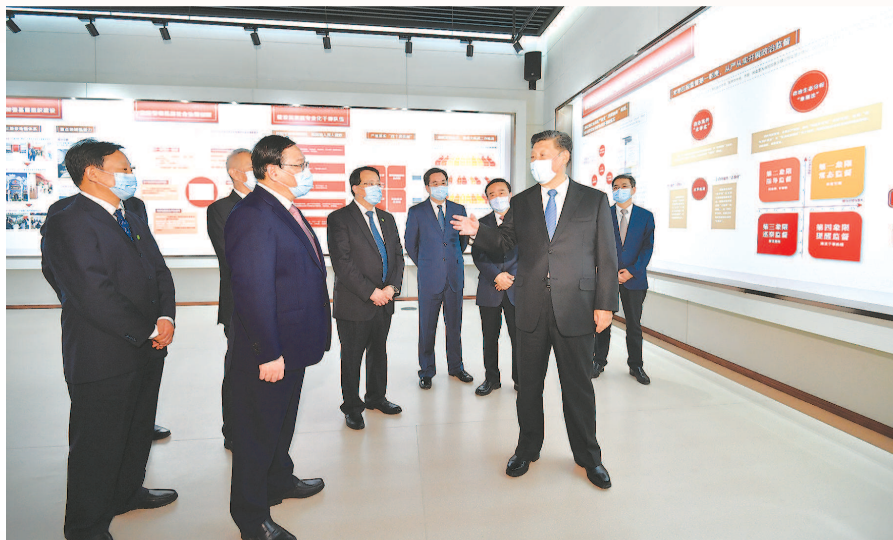
■ 昨天上午,习近平等参观“在国家战略的引领下——浦东开发开放 30 周年主题展”

参观“在国家战略的引领下——浦东开发开放 30 周年主题展”，亲切会见部分代表 李强主持大会 丁薛祥刘鹤陈希何立峰出席