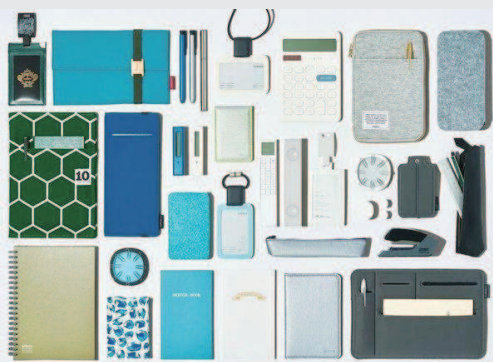
■ 文具控选购文具首先是凭“眼缘”