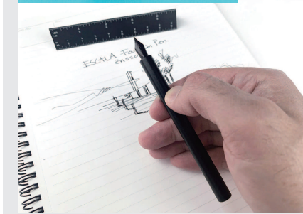
■ 带有刻度尺的一体化钢笔