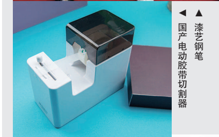
▲ 漆艺钢笔 ▲ 国产电动胶带切割器

设计文具不仅是个要对各种细节拿捏恰当的技术活,更是具有社会责任的“良心活”。能让文具控拥有百分之百放心的“小确幸”真心不易。