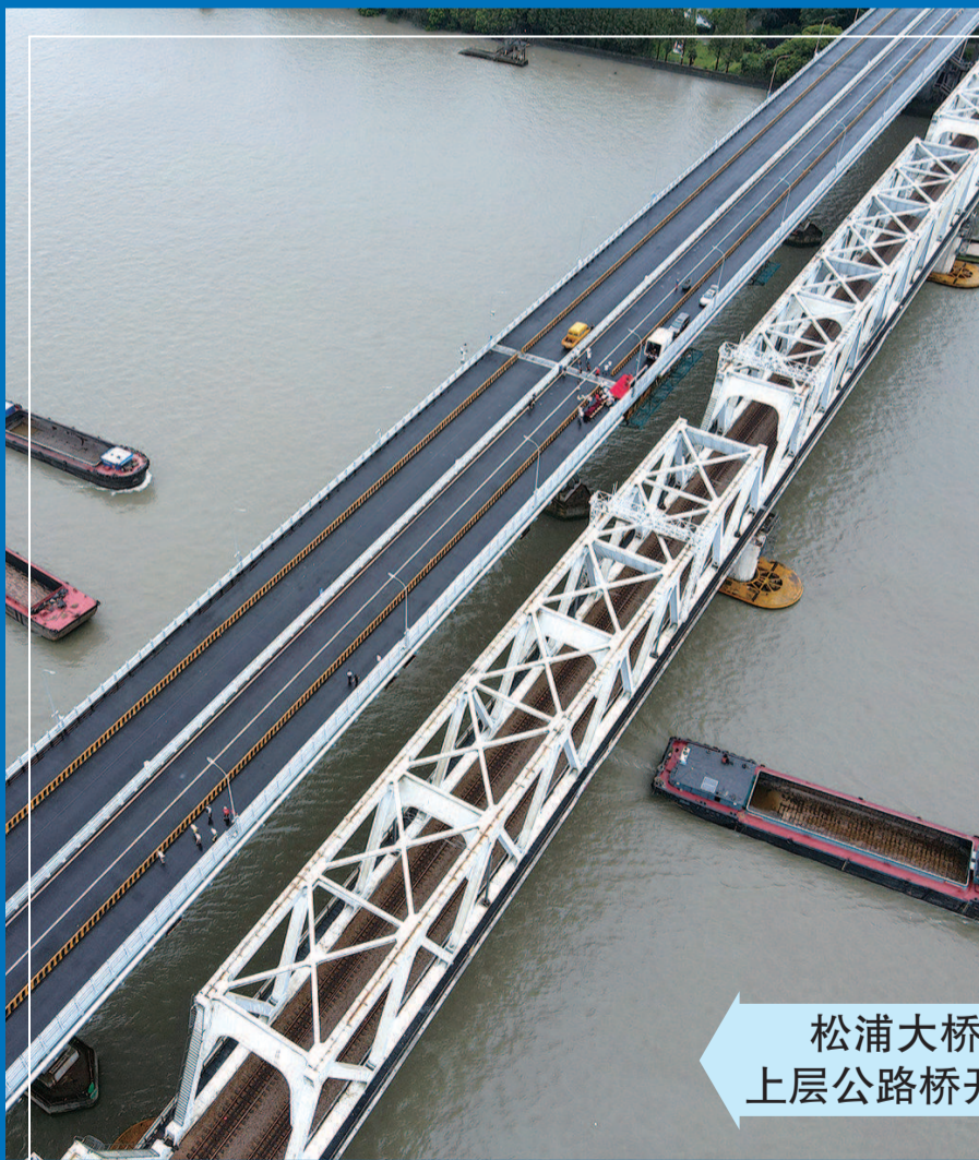
松浦大桥 上层公路桥开通