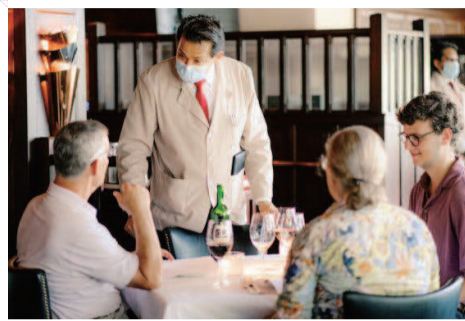
●英国自然历史博物馆(上图)、空荡荡的影院(上图)及餐厅服务员全程佩戴口罩(下图)