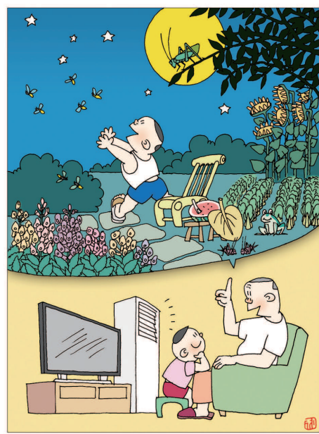
听爷爷讲乘凉的故事 漫画