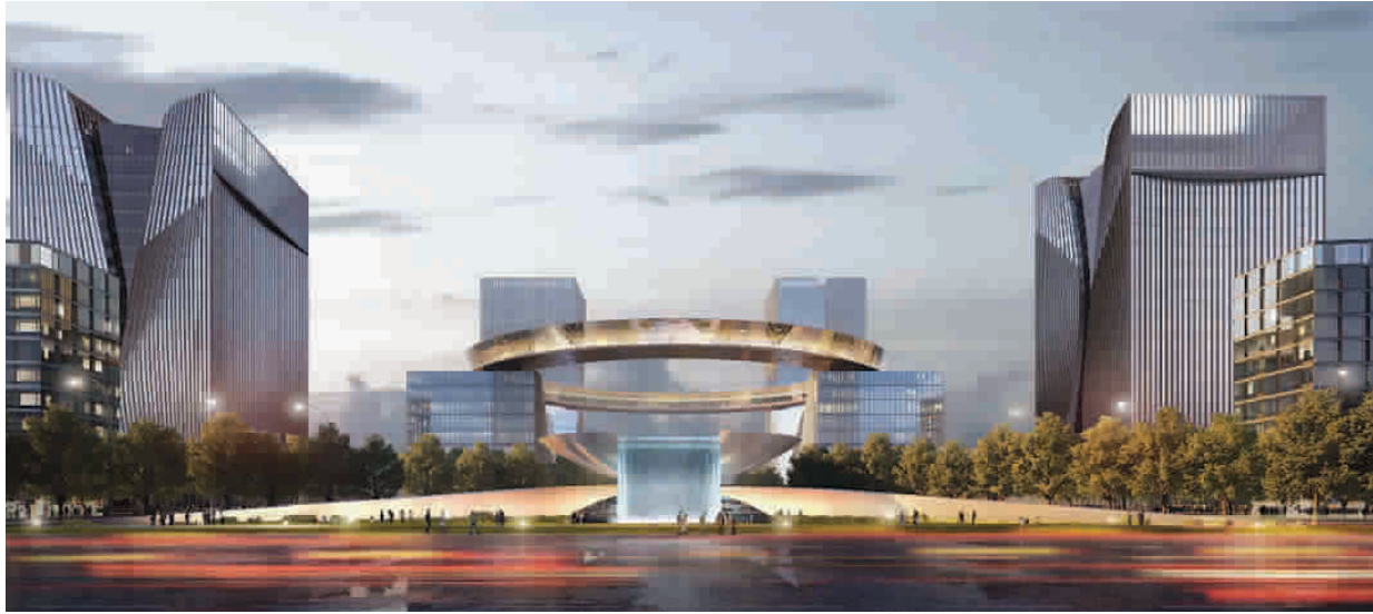
◀ 滴水湖金融湾“荣耀之环”效果图