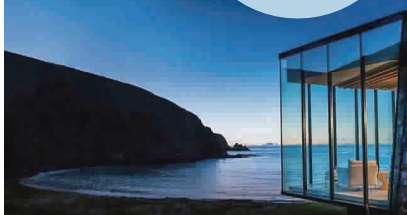
新西兰海景水景度假屋