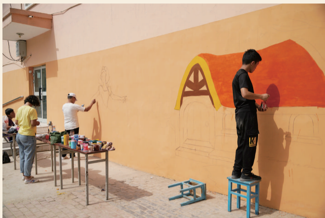
中午时分,福利中心的年轻人在墙上挥笔作画

小,但她来福利中心已有4年。“我是小学二年级来的,当时不习惯,觉得一切都陌生。但这里的老师对我很好,慢慢地,我就喜欢上这里了。”小姑娘的普通话说得很标准。她对来这里度过的第一个六一国际