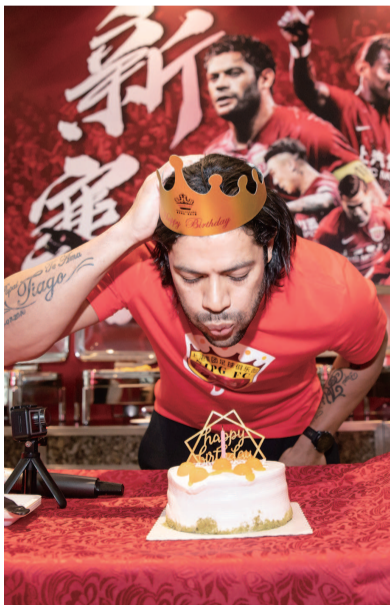
■ 胡尔克在苏州驻地过生日