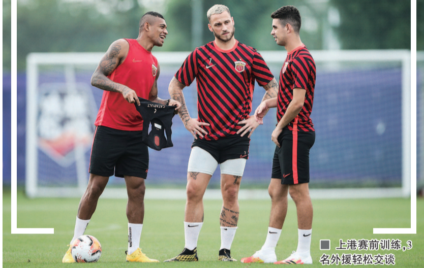
■ 上港赛前训练, 3名外援轻松交谈

中超诸强中, 上港队是最后一个亮相的。今晚7时35分, 他们将在昆山体育中心迎来与天津泰达的较量。作为新赛季的夺冠大热门之一, 外援到位、人员齐整的上港会表现如何, 无疑是外界关注的焦点。相比之下, 对手泰达队受到的影响颇大, 很可能只能以单外援上阵, 完全处于下风。