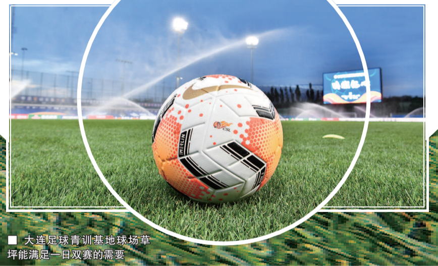
■ 大连足球青训基地球场草坪能满足一日双赛的需要