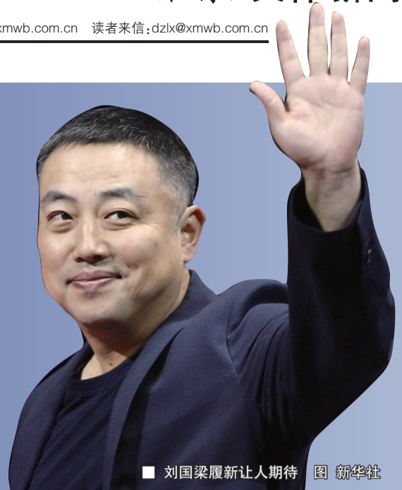
刘国梁履新让人期待

这是超出金牌之外的挑战,刘国梁敢于担当。在世界舞台推广乒乓球项目,他和中国乒乓迎来新机遇、新挑战。