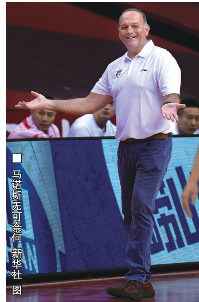
马诺斯无可奈何

特派记者 李元春(本报青岛今日电) 上视五星体育频道明天15时30分将转播CBA上海久事与广州龙狮比赛实况。