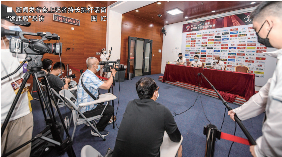
■ 新闻发布会上记者持长挑杆话筒“远距离”采访