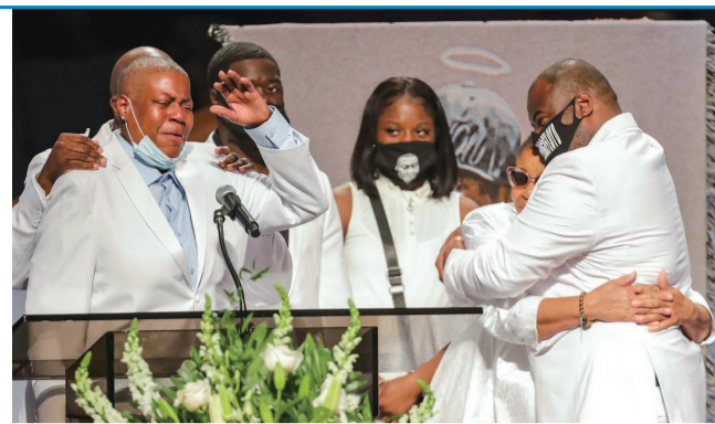
■ 弗洛伊德的家人在葬礼上相拥而泣