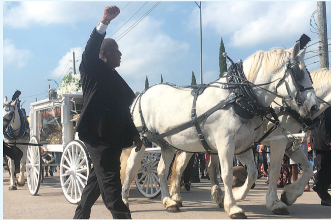
■ 马车运送弗洛伊德的灵柩到达墓园