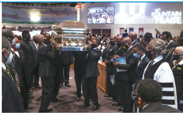
■ 弗洛伊德葬礼现场