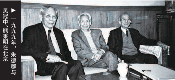
▲ 一九九九年，朱德群与吴冠中、熊秉明在北京