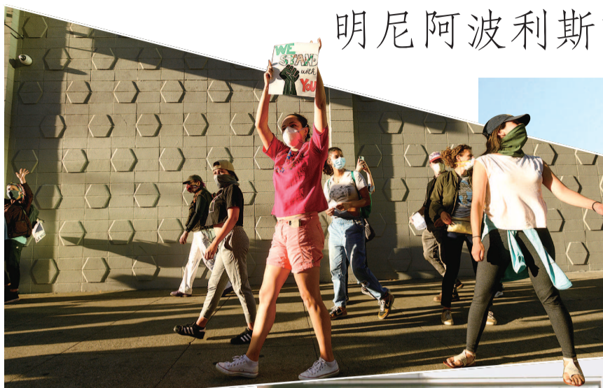
■ 奥克兰青少年参加抗议活动