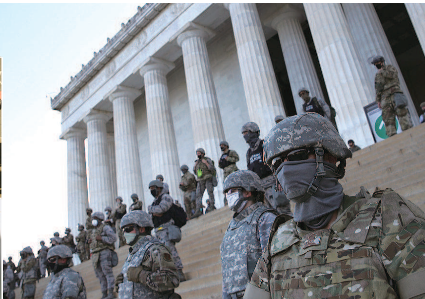
全副武装的军警在林肯纪念馆前警戒