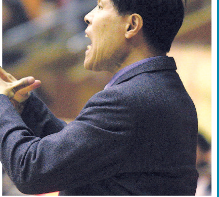
■ 2006年,时任浙江队主帅的蒋兴权现场指挥

蒋兴权曾三度出任中国男篮主帅,1994年率队获得世锦赛第八名,创造中国篮球历史。那次世锦赛上,中国男篮曾在对阵劲旅西班牙队时上演绝地大逆转,在上半场落后对手17分的情况下成功翻盘,从死亡之组出线杀进八强。当时蒋指导在暂停时喊的那句“立功算你们的,输了算我的”,也成为中国男篮历史上的经典名言。 在CBA历史上,蒋兴权执教过辽宁、新疆、浙江、天津、佛山等球队,他曾三次率新疆队杀入CBA总决赛,为该队后来的夺冠奠定坚实基础。执教几十载,老蒋为中国篮球培育出的国手太多太多,例如吴庆龙、刘玉栋、张劲松、巩晓彬、阿的江、孙军、单涛、胡卫东、郑武、纪敏尚等,组成了“94黄金一代”。他的不少弟子也走上教练之路,有的如今早已成为中国篮坛名帅,例如宫鲁鸣、李春江、吴庆龙、阿的江等。 由于长期活跃在CBA一线执教行列,蒋兴权也被称为“常青树”。自2012年离开新疆队后,外界以为72岁的老蒋会就此隐退江湖,没想到休整了一年之后,他2013年4月份又在佛山队重新出山——当时他的出山确实出乎很多人的意料,毕竟已经到了古稀之年。 这么多年,蒋兴权转战CBA各支球队,平时除了篮球也没什么爱好,过着近乎于苦行僧般的生活,但是他对此却甘之如饴——在球场上看着年轻队员的成长,是他最大的快乐。 2015年初从佛山队退下来之后,蒋兴权曾公开表示不会再在一线工作,毕竟自己年龄大了,想休息休息。但是两年之后,他又忍不住出山了,2017年受邀担任浙江队顾问,这一干就是整整三年。