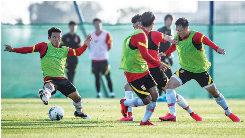
■ 今年 3 月,国足在迪拜集训