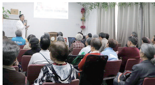
往届“保松牙科普现场”

新民健康工作室联合知名中老年口腔机构院长、专家，为饱受松动牙、缺牙困扰的叔叔阿姨们带来面对面线上口腔健康指导建议，科普先进的保松牙理念（仅限每日前20名）。