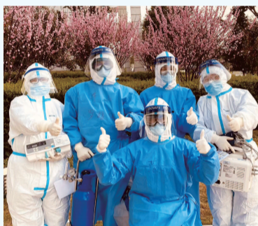
■ 纪录片团队与援鄂医护人员合影

4月8日,武汉解封,从上海出发的第一批赴鄂纪录片人已经平安归来,等待他们的,是妻儿的拥抱、父母的饭菜,以及每一天平凡生活的回归。他们走过武汉寂静街道,拍过空无一人的长江大桥、黄鹤楼,体会过步履匆匆的沉重,当岁月静好又回到了街头,欢声笑语又洋溢在了人间,他们想起在武汉的时光,一位导演说,“如何度过挑战?硬扛呗。”