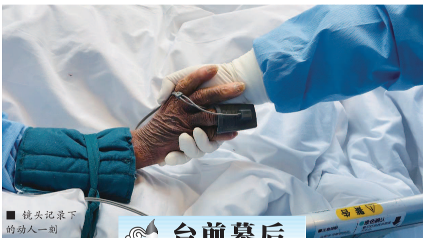
■ 镜头记录下的动人一刻