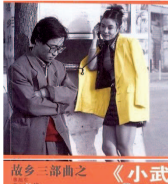
故乡三部曲之《小武》