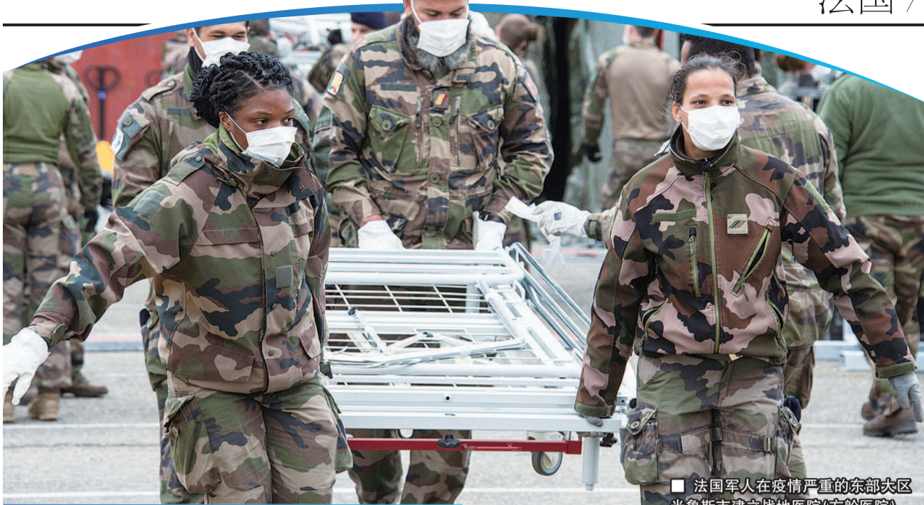
法国军人在疫情严重的东部大区米鲁斯市建立战地医院(方舱医院)