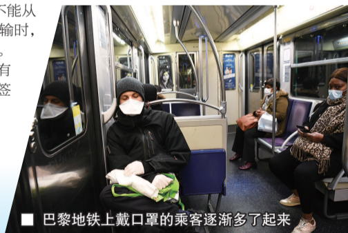
巴黎地铁上戴口罩的乘客逐渐多了起来

政府发言人恩迪亚耶表示,在日常情况下,每个法国人平均每天要与50个人打交道,政府的目标是将这个数字除以10,因此希望法国人尽量待在家里。 来米