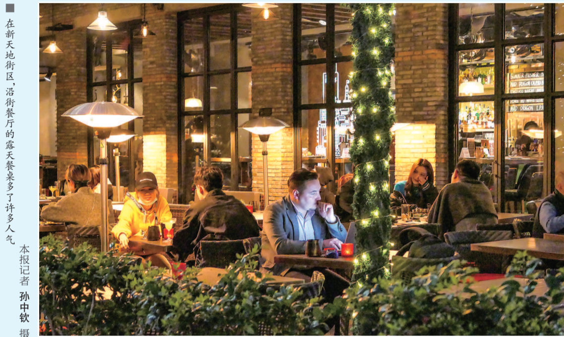
在新天地街区,沿街餐厅的露天餐桌多了许多人气