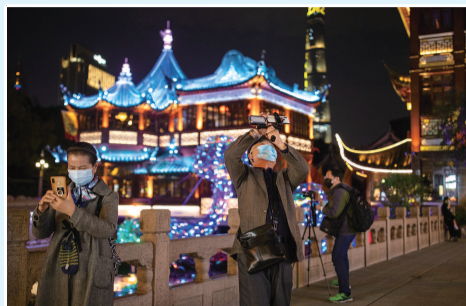
豫园商城内八成店铺已恢复营业,市民游客在九曲桥边拍照