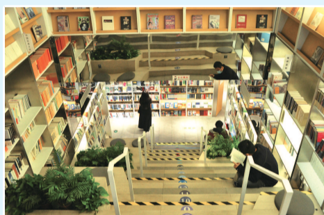
杨浦区大学路商业街人气逐步回归,年轻人走进书店品味墨香