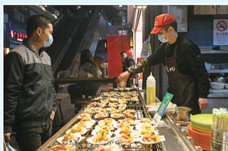
金山区海汇街的店铺都已开业,市民品尝各种小吃