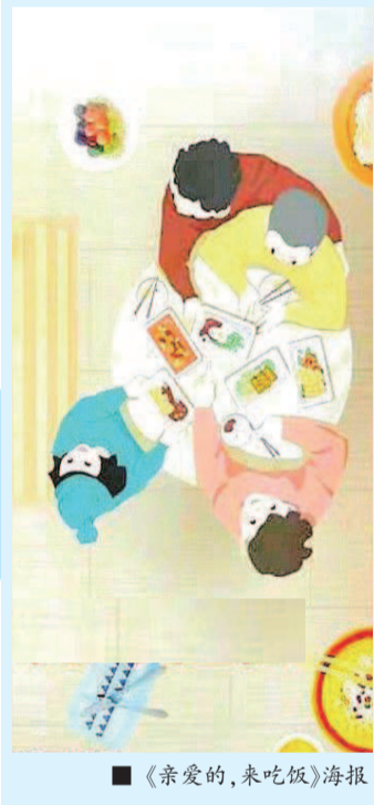
■《亲爱的，来吃饭》海报