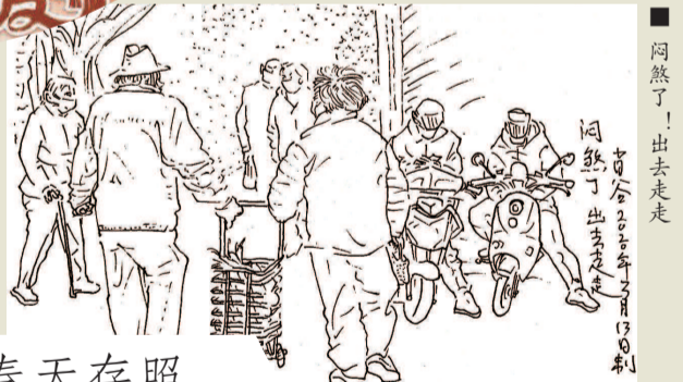
■ 闷煞了！出去走走 肖谷 2020年3月13日制