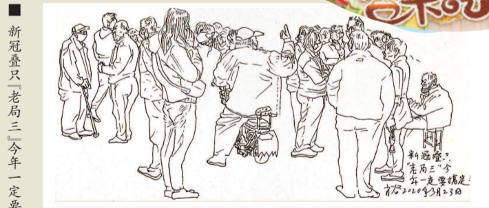
■ 新冠叠只「老局三」今年一定要搞定