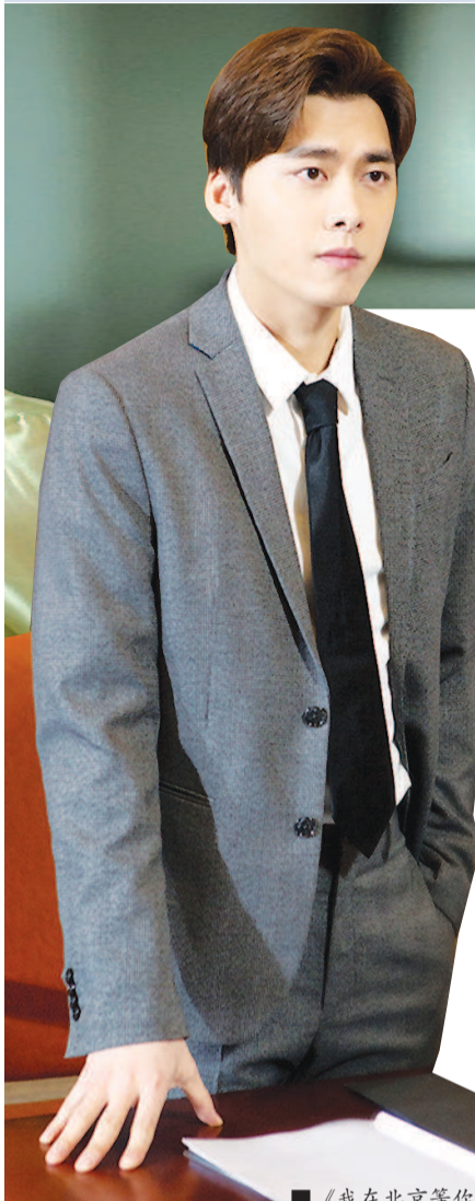
■《我在北京等你》剧照