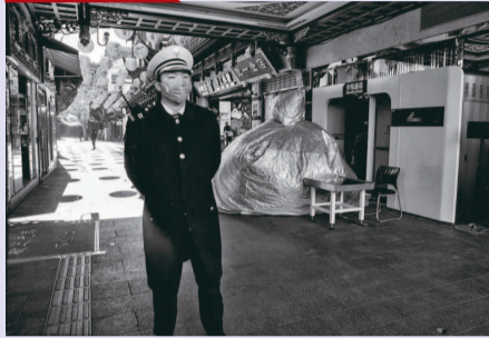
此时被束之高阁 是为应付看灯大客流用的, 但 上海豫园, 入口处的安检机