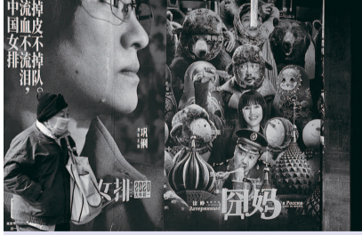
响, 新年贺岁片全线叫停 上海大光明电影院, 受疫情影响