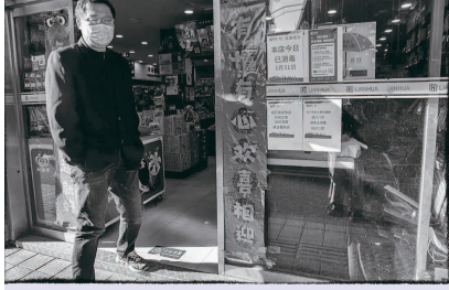
员出来透气 上海浙江中路「联华超市」, 店