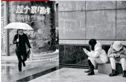
大年初二的南京东路街头