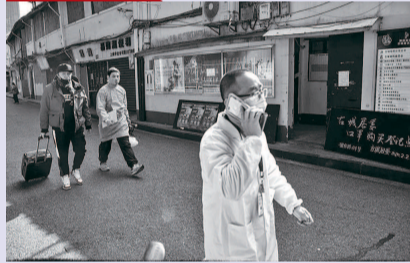
疫情信息, 赶去消毒 控中心的工作人员, 接到 福佑路, 黄浦区防疫疾