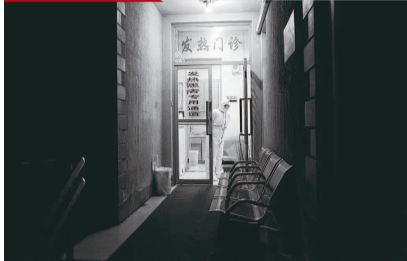
院发热门诊区的医护人员 大年三十夜晚, 上海同济医