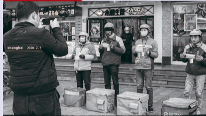
递要安全, 并拍照留档 上海徐汇, 组长给快