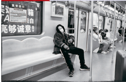
MSD口罩的乘客 上海地铁二号线, 一个戴着