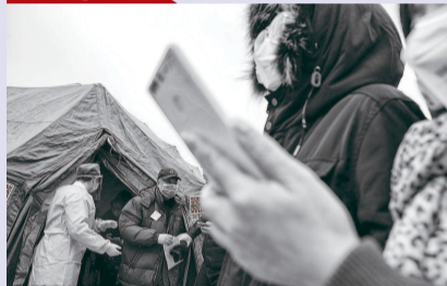
上, 没有硝烟, 只有战斗 立在上海长海医院广场 四顶军队野战帐篷算