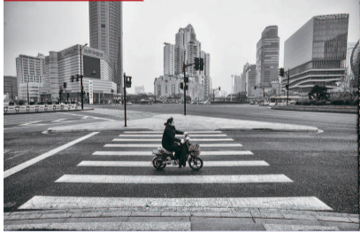
都宅在家中 徐家汇, 响应号召, 大多市民