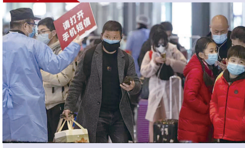
济共保一方平安 了这座城, 为了城中人, 大家同舟共 上海虹桥火车站, 复工的人群, 为