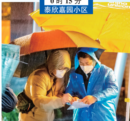
0时15分 泰欣嘉园小区

料峭寒风中,申城疫情防控各检测点还是灯火通明,各个居民小区门口的简易帐篷里有一群“夜不归宿”的社区志愿者。