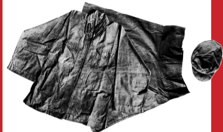
■ 红军第一次统一配发的军装