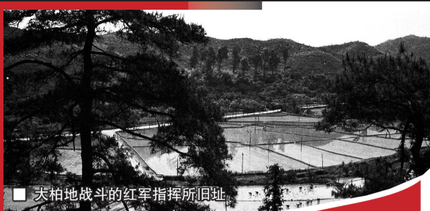
■ 天柏地战斗的红军指挥所旧址