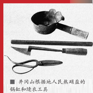
■ 井冈山根据地人民熬硝盐的锅缸和缝衣工具