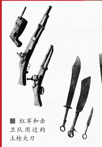
■ 红军和赤卫队用过的土枪大刀