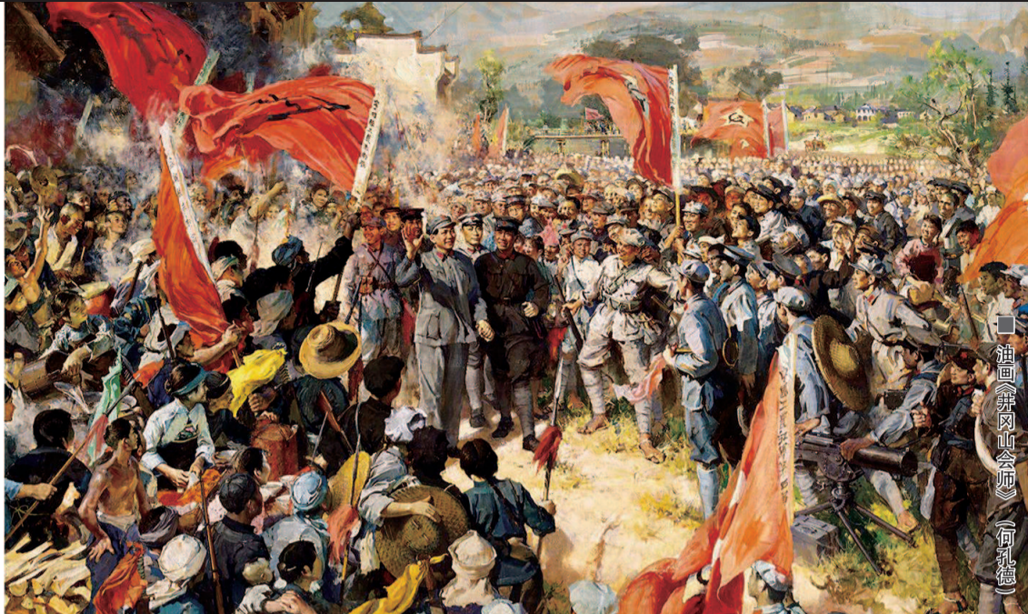
■ 油画《井冈山会师》何孔德

90年前，人民军队第一个战略集团——红一方面军正式成立，标志着革命武装力量进入新的发展阶段。您可曾知道，这一成就得益于红军上下实事求是，不拘