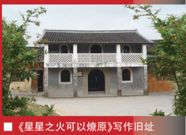
■ 《星星之火可以燎原》写作旧址