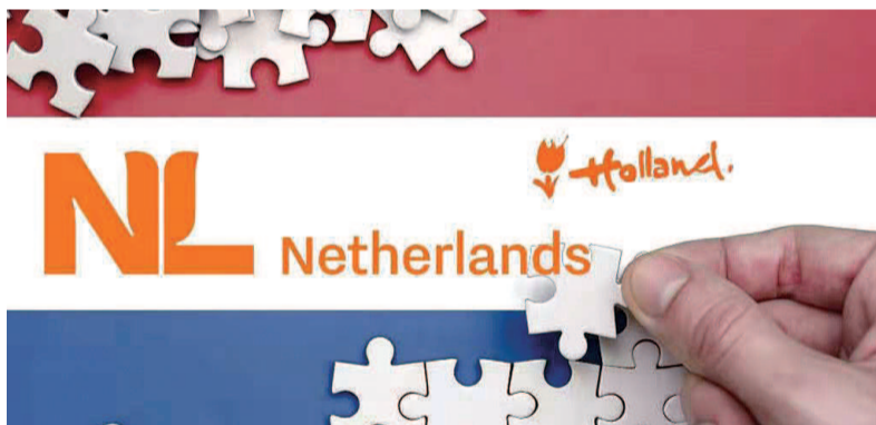
荷兰人希望人们能使用「尼德兰」这一称谓

个国家12个省份中的两个——阿姆斯特丹所在的北荷兰省以及鹿特丹、海牙所在的南荷兰省。这两个省份早在19世纪就成为经济中心,此后一直在荷兰的对外宣传中处于中心地位。直到今天,这几个城市仍然是荷兰对外知名度最高的城市:阿姆斯特丹是首都及第一大城市,鹿特丹是第二大城市及航运中心,海牙是第三大城市和国际法院的所在地。在旅游和吸引外资层面,毫无疑问占有巨大优势。另一方面,按照外交部一名发言人的说法,突出“荷兰”的对外宣传方式,造成了荷兰省的过度旅游,观光客涌入郁金香花田、风车村、国际法庭等景点,让人口规模并不大的上述城市“感到疲倦”。