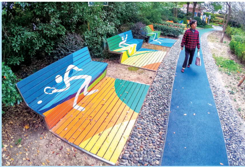
徐汇区长桥街道体育花苑内,休息座椅设计别致,椅面上的彩绘鲜亮明快,富有运动元素