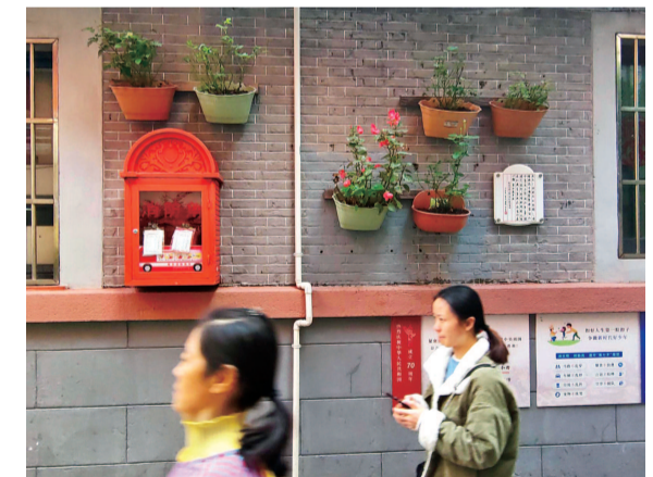
北京东路贵州小区弄堂里,居民楼外墙上的消防角呈石库门造型,一盆盆鲜花为冬日弄堂增添了一份春意