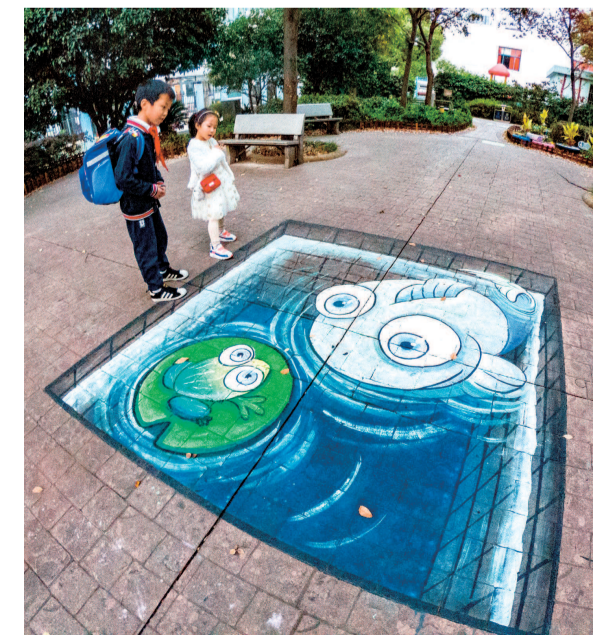
宝山区馨康苑里,地面的3D立体画配合新建的微型儿童乐园,为社区增添了不少生机