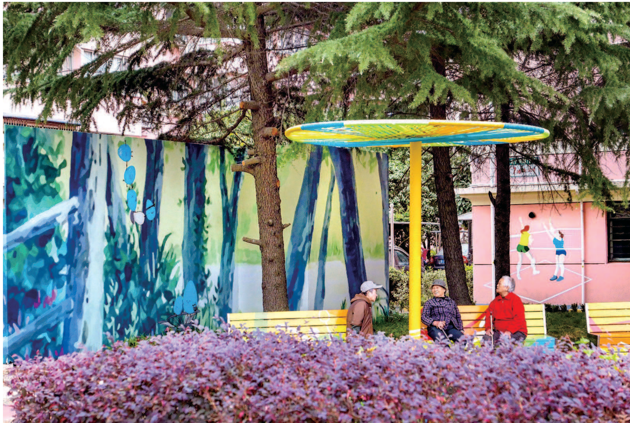
被评为“全国最美志愿服务社区”的徐汇区体育花苑内,围墙、房屋、座椅、健身器材上的各式彩绘将建筑和周围景物融为一体,行走其间如在公园一般