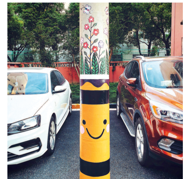
水清一村内,路灯上的卡通画充满童趣