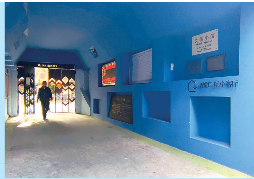
北京东路的贵州小区入口处,凹凸设计的墙面既方便居民坐下休息,又能摆放宣传板等物品