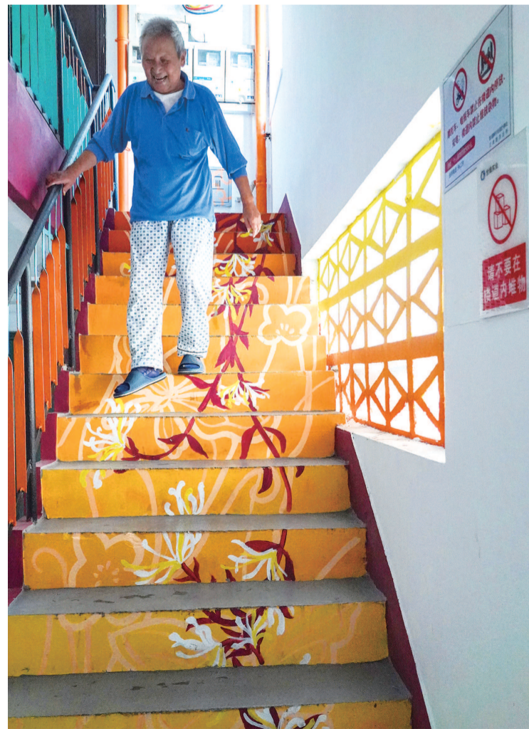
浦浦新村街道银都一村94号楼内,金银花图案让人心情舒畅

当微更新成为风潮,申城老旧小区纷纷开启“逆生长”之旅。看,心思折射大智慧:一朵小花、一个铁架、一条步道,就能点亮心情。闵行区水清一村“小花”电线杆总能“萌翻”路人。创意源于设计师发现小区内有一群绿植高手,于是便让小花小草调皮地“爬”上了围墙和电线杆,“网红”花园因此诞生。对于黄浦区宏兴里的居民来说,新增的“共享晾衣场”解决了一桩心事:除了晒衣之外,架上还能挂灯笼、吊盆栽。遇上晴天,漫步架下,能闻到阳光的香味。徐汇区体育花苑的不少居民近来都爱“打卡”家门口的“七彩馨愿步道”。正是这条彩虹步道,为运动人生增添斑斓的色彩。 看,老社区还有新潜力,因为一个有故事的地方总让人牵肠挂肚。塘桥街道的码头原是浦东大型停泊码头之一,这里也是国家级非遗“上海港码头号子”的传承地。金浦小区在广场微更新时为突出码头号子元素,入口引入码头工人雕塑,户外舞台扩建也考虑码头号子表演队的演出需求。每次演出,不仅本区居民捧场,还吸引了不少周边社区居民驻足。一来二去,这里成了热闹的公共会客厅。有着近百年历史的丰裕里“老枝发新芽”,在淡水路214弄,每块墙砖、每处转角,都透着老上海风情。海派艺术家李守白受邀绘制了《母子情深》、《岁月留痕》等作品。红墙砖依旧,老弄堂还多了一份艺术韵味。有住户点赞道:“没想到老房子还有这么一天,真是将日子过成了诗!” 家,因为有熟悉的味道而倍感亲切;家,也因为通向更好的未来而让人期待。微更新的魔法就是把回家变成每一天最幸福的事。