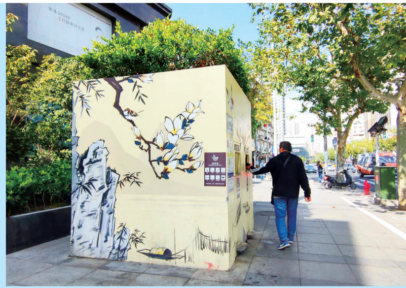
常德路近西康路一小区外,一个垃圾房四周墙面画满玉兰花开的彩绘,房顶还种上了绿植,乍一看还以为街头的大型装置作品呢