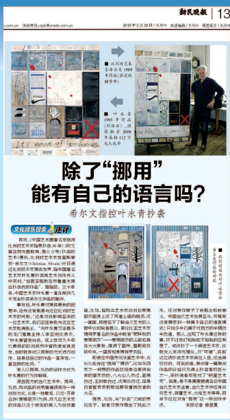
除了“挪用”能有自己的语言吗? 希尔夫指控叶永青抄袭

“我们可以确定地说，西尔万是他这一代最重要、最真实的艺术家之一。”虽然有评论这么认为，但是在中国，比利时艺术家克里斯蒂安·西尔万(Christian Silvain)的名字被人广为知晓，是和他的作品被中国艺术家叶永青抄袭事件紧密联系在一起。明天起，这位艺术家的原作将在上海建投书局展出了。以“记忆 / 2019: 西尔万原作中国首展”为题的展览上，16幅原作将以西尔万的童年为起点，在其独具特色的绘画风格中，带我们走近30年前艺术家的童年。