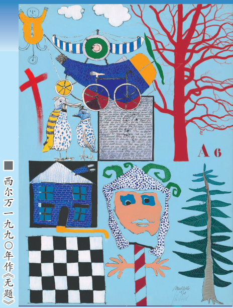
西尔万一九九〇年作《无题》