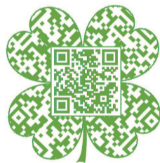
一码“视”界 进博精彩汇 新民晚报全媒体出品

进博会参展商纷纷拿出了明星展品！本报邀请你一边玩游戏，一边逛线上进博会，为展品和展商配配对，全部配对成功代表寻宝成功！看看你能找齐多少进博会“宝贝”？