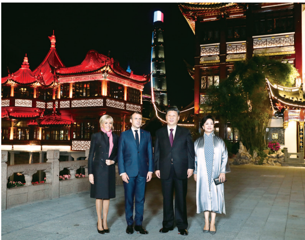
■ 昨晚，国家主席习近平和夫人彭丽媛在上海豫园会见法国总统马克龙和夫人布丽吉特