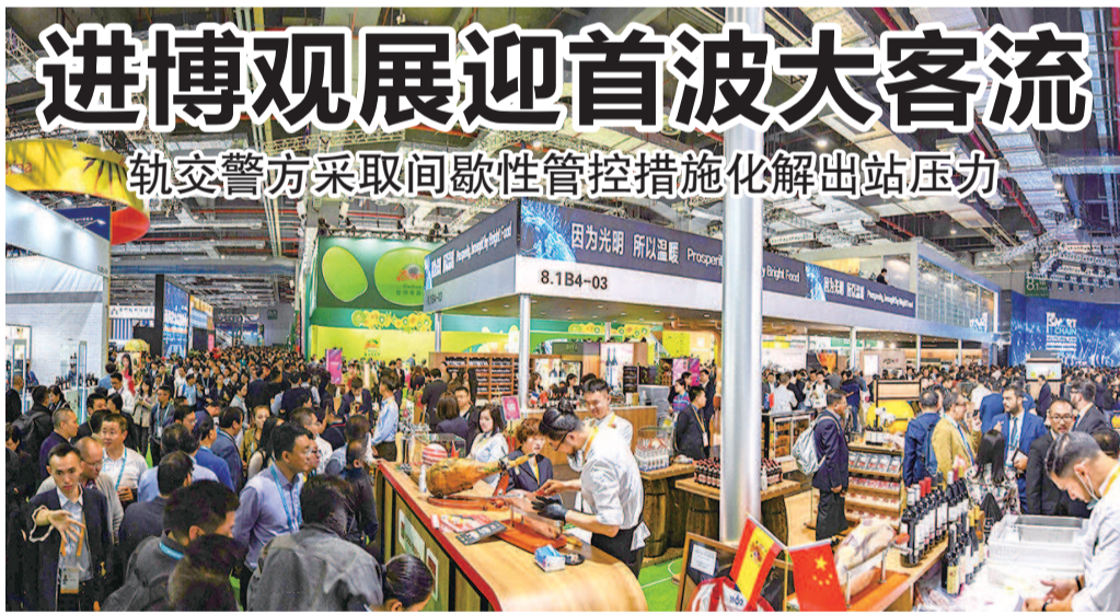
■ 进博会场馆迎来首波大客流